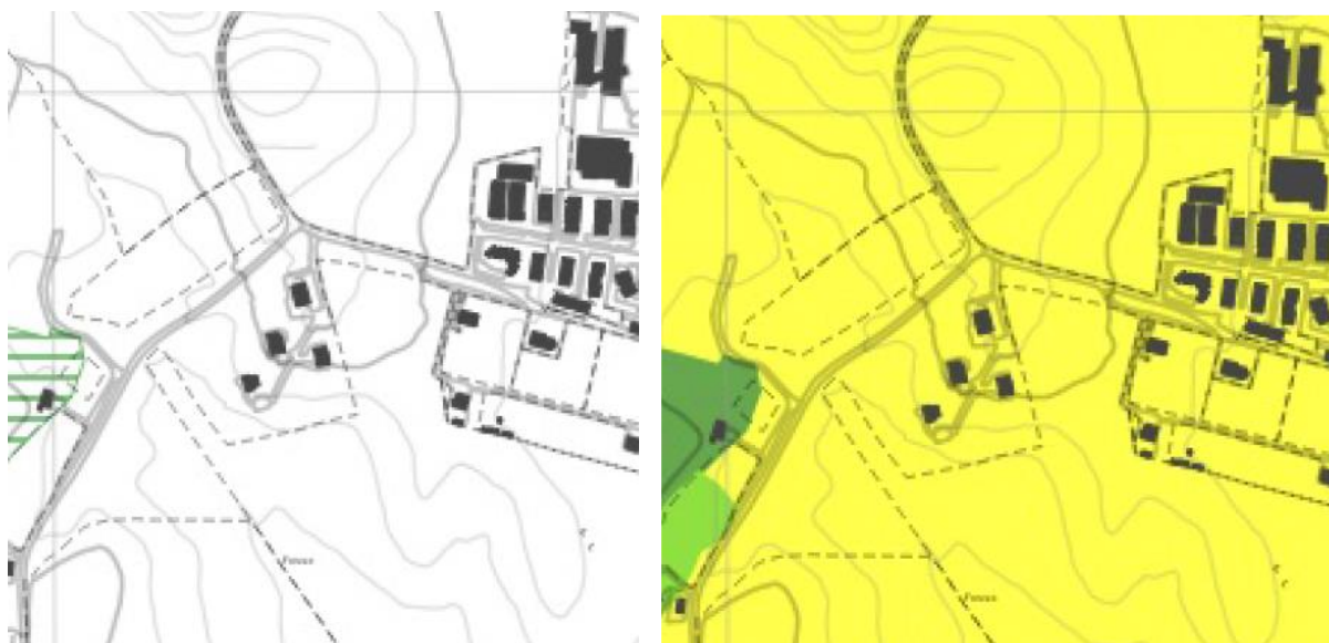
Stralcio tav. 20- 365 B e A di PTPR

Inoltre, sempre nell'ambito del PTPR approvato, ai fini della disciplina della tutela, d'uso e valorizzazione dei paesaggi, di cui al Capo II delle NTA, l'area di intervento ricade nel "Sistema del paesaggio agrario" in ambito di "Paesaggio Agrario di valore" (tav. A).